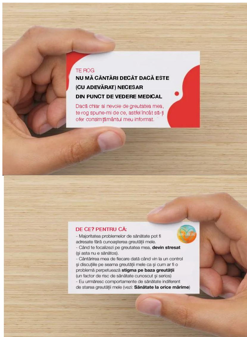
Figura 6.3. (b1,b2) Cartonase "Nu mă cântăriți" https://more-love.org/free-nu-cântăriți-mă-carduri/?fbclid=IwAR0zfrnx8QsrWHYNFA9Bn9wLQARemgj7Fn4C-pKliWxLJfE273dIchWP_go